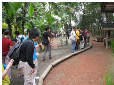
戶外活動 新竹北埔之旅 搶救特殊生菜菜子英文