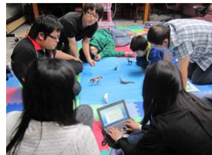
人際關係成長團體