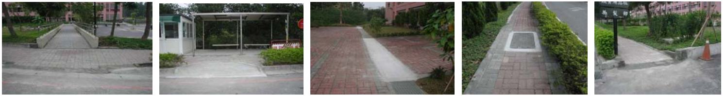
斜坡道改善 候車亭斜坡出入口 建築物入口水溝加蓋 人孔蓋與地面高度一致 高低差改成斜坡