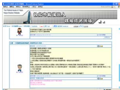
圖 9 政見資訊網留言與對話