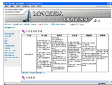
圖 2 政見資訊網政見議題導向網頁