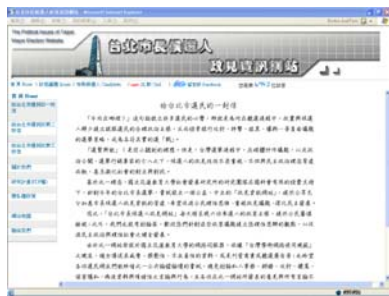
圖 1 政見資訊網首頁