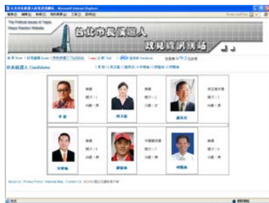
圖 3 政見資訊網候選人導向網頁