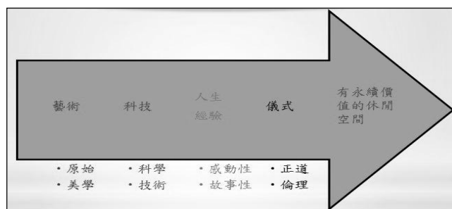
圖 2 休閒空間的永續形成要件

綜合以上文獻發現，休閒活動的分類方式會因研究對象、研究區域或研究重點之不同而有所差異，每種分類方法各有其目的、性質、功能及優缺點，欲選擇何種分類方法，端視研究者之研究重點為何來決定。陳彰儀(1989)指出一般用來分類休閒活動主要有三種方法，分別為主觀分類法、因素分析法與多元尺度評定法。本研究先採用主觀分類法並透過文獻分析各研究者的分類向度及實地參考蘆竹鄉休閒空間類型後做為編製預試問卷的依據，將蘆竹鄉的休閒空間分成購物、主題餐廳、低碳、運動、體驗式及鄉公所薦選等六大類休閒空間，俟預試問卷施測完畢後再進行因素分析，以掌握這些問題是否可以有效的測量到研究構念，並作為正式問卷的調整向度及編題之依據。針對以上的休閒空間論述，本研究將蘆竹鄉的休閒空間，界定如圖 2。