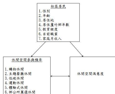
圖 3 研究架構表

討，並探究不同背景變項所造成的影響，綜合文獻探討的結論後，提出本研究架構如圖 3。